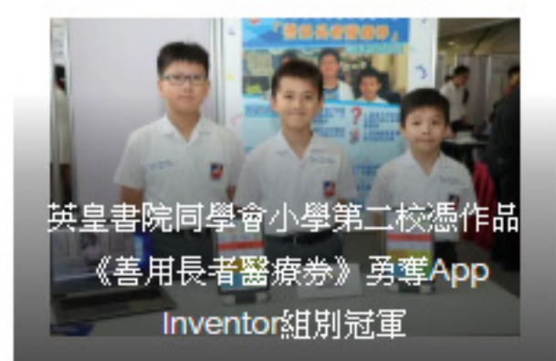
英皇書院同學會小學第二校憑作品《善用長者醫療券》勇奪App Inventor組別冠軍

App Inventor組別展出作品意念突破創新，涵蓋食、住、行三方面。樂華天主教小學隊伍研發「買謎易」，顧客在線上與店家購買新鮮蔬菜，並預約領取謎菜，讓大家一App式購物，方便快捷；英皇書院同學會小學第二校則運用 Map 和Marker 功能，方便用家發起「的士團」，善用公共交通資源之餘亦可平分車費惠及經濟；而荃灣商會學校利用自家電腦進行人臉分辨技術，阻止陌生人亂入民居，費用低又可確保家居安全。另外，中華基督教會協和小學打造智能吸音機Bird，即使主人不在家中都可以用聲音陪伴鸚鵡；大埔舊墟公立學校所設計的應用程式能即時上載流浪貓位置及進行領養配對，藉此宣揚領養訊息。