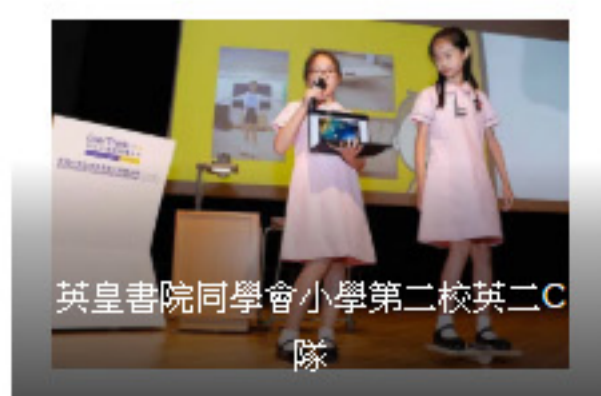
英皇書院同學會小學第二校英二C隊