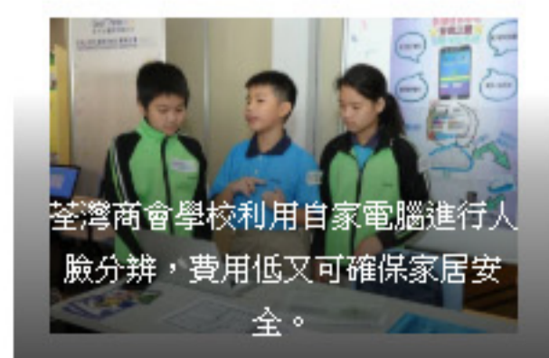
荃灣商會學校利用自家電腦進行人臉分辨，費用低又可確保家居安全。