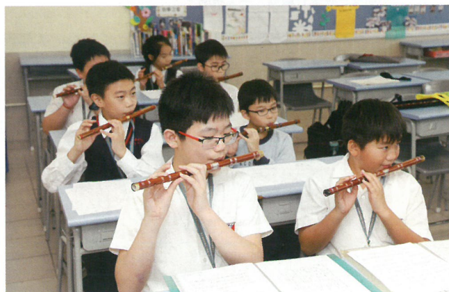
小朋友吹簫相當不錯，悅耳動聽。