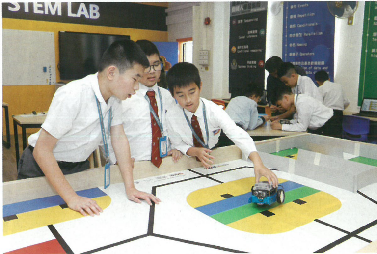
小朋友正在研究如何操作這部遙控車。

由於STEM已經推行了一段時間，為了能夠與時並進，讓學生能夠學習最新的知識，該校亦不斷為STEM課程注入新元素，他們安排小六學生進行「跨學科專題研習」，使他們能夠活用知識，學習解決問題，豐富他們的學習經驗。