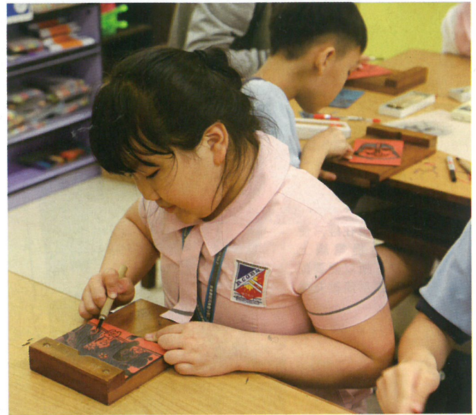
小朋友正在進行雕刻，手工精細。