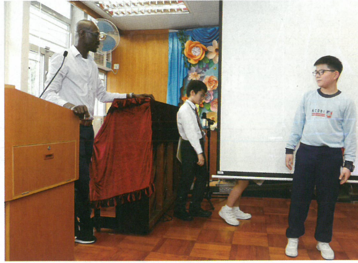
外籍老師教授英語話劇，訓練小朋友的英語能力。

基於學校的發展趨勢： 建基於現時學校於電腦科進行「運算思維教育」的成功經驗、大力投放資源於科技及科學探索，成立STEM LAB及增加運算思維教育課時等有利因素下，乃適當時機全面推行STEM課程。