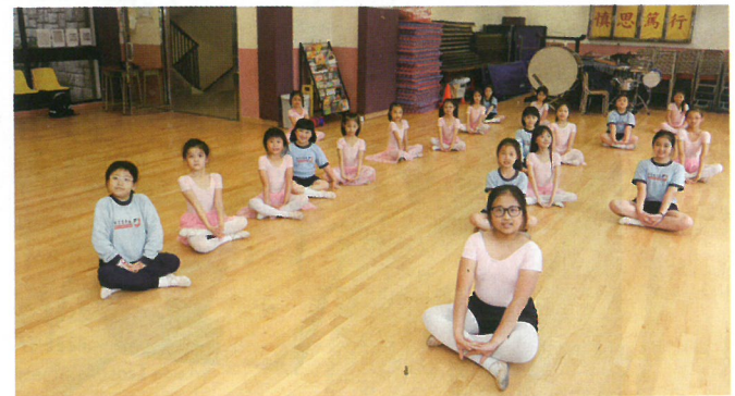
課餘校方為學生提供芭蕾舞課程，女孩就最鍾意。