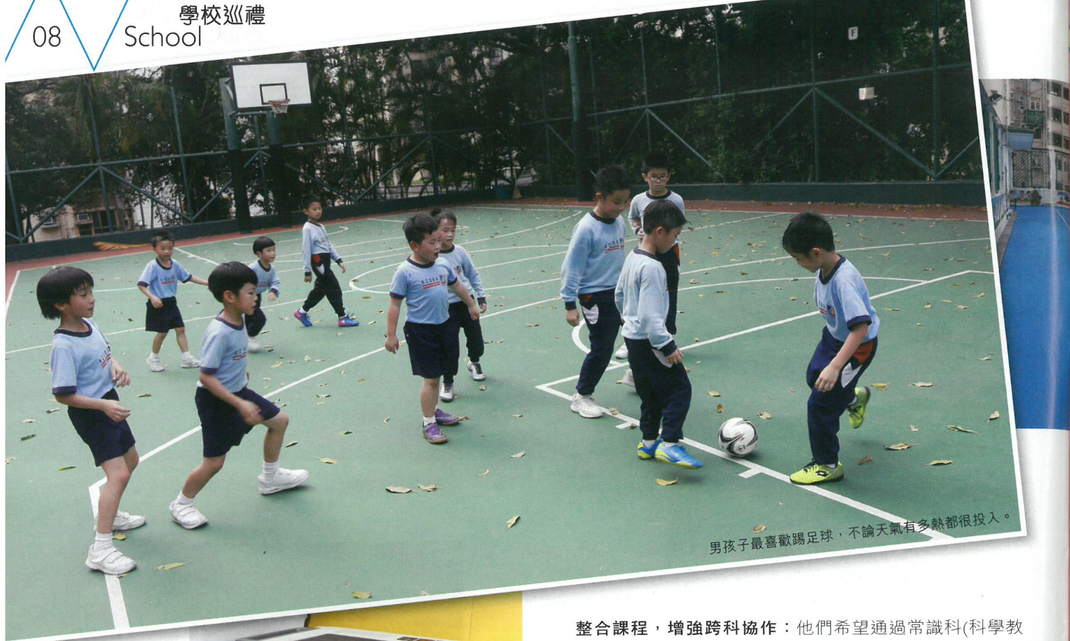
男孩子最喜歡踢足球，不論天氣有多熱都很投入。